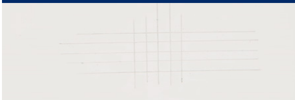
Adhérence de l'alkyde vieilli - Surface non poncée (Dulux 23010)