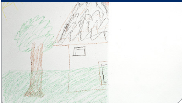
Dessin d'enfant au crayon de cire - recouvert d'une seule couche d'apprêt

Cette toile de maître a été complètement recouverte par une seule couche d'apprêt alkyde à base d'eau Dulux X-pert. Évidemment, nous ne critiquons pas la qualité de l'œuvre d'art, mais il est bon de savoir que vous avez entre les mains un produit capable de redonner une toile vierge à vos artistes en herbe.