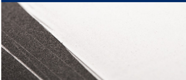
Latex acrylique semi-brillant standard