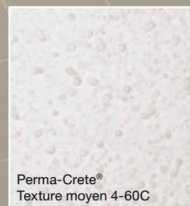
Perma-Crete® Texture moyen 4-60C